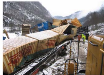
Figur 3: Deler av toget