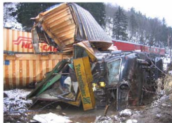
Figur 2: Bilde av lokomotivet