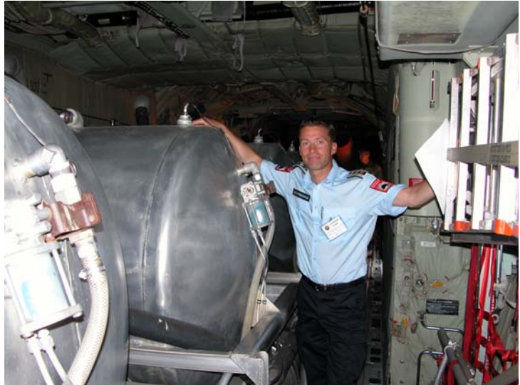
ICS vannbomber: Artikkelforfatteren i Hercules vannbombefly (NIFC, Boise USA).

I Øvelse Oslo er jeg den lokale brannsjefen, og jeg ber om hjelp fra nabobrannvesen i regionen.- Drammensregionens brannvesen, Asker og Bærum brannvesen, Nedre Romerike brann- og redningsvesen og Nordre Follo brann- og feiervesen. Disse er ”forhåndsvarslet” og positive til å delta på øvelsen. I reelle hendelser av den størrelse vi forventer oss i Øvelse Oslo, ville jeg slått den geografiske sirkelen enda større enn dette. Det er ingen grunn til at vi ikke skal kunne trekke på ressurser som befinner seg to timer unna i kjøretid. I øvelsen skal fem brannvesen gjøre innsats samtidig i komplekse hendelser. I tillegg vil Siviltforsvaret bidra. Det krever et forutsigbart system både for den som avgir ressurser og den som mottar. ICS er et slikt system.